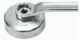
めがねレンチ使用