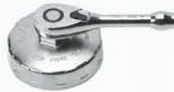
ラチェットハンドル使用